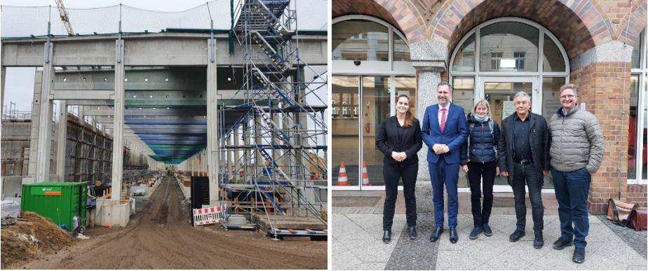
Erster Stopp war die Baustelle des Bahnwerkes, danach ging es ins Rathaus zu Tobias Schick (2. Von links)

Im Anschluss an die Baustellenbesichtigung haben wir den Lokaltermin auch für einen Besuch im Cottbusser Rathaus genutzt. Dort trafen wir uns mit dem erst kürzlich gewählten Oberbürgermeister von Cottbus, Tobias Schick (SPD). Mit ihm sprachen wir über seine Vorhaben und Ideen, wie auch über den Strukturwandel in der Region.