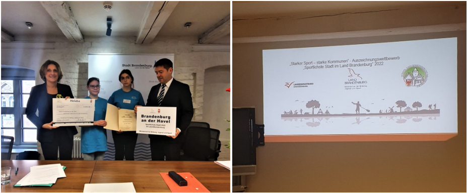
Prominenter politischer Besuch in Brandenburg: Britta Ernst bei der Urkundenübergabe

Die Sportstadt Brandenburg kann stolz auf sich sein, denn mehr als 11.000 Einwohnerinnen und Einwohner der Stadt sind in über 80 Sportvereinen engagiert und aktiv. In fast 60 Sportarten gibt es Angebote von allgemeiner Sportgruppe bis Wasserball, Inklusions- und Integrationssport sowie Kita- und Schulsport. Mit dem Preisgeld in Höhe von 5.000 Euro will die Stadt ein Projekt zur Verbesserung der Teilhabe von inklusiven Sportlerinnen und Sportlern finanzieren. Das Geld geht dabei an die Havelschule, eine Schule mit den sonderpädagogischen Förderschwerpunkt „Geistige Entwicklung“. Mit dem Geld soll ein Sportgerät für den Schulhof beschafft werden, um diesen bewegungsfreundlicher zu gestalten.