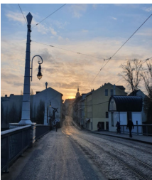
Ein Sonnenaufgang im Winter