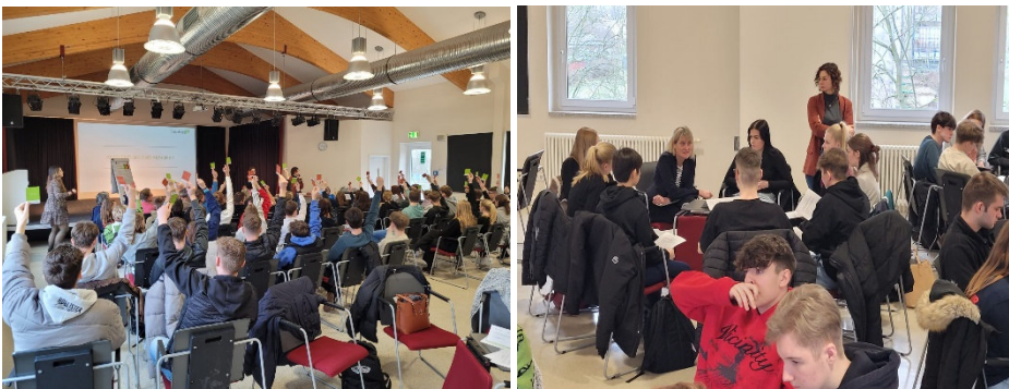
Ein Blick in das Plenum der Schülerinnen und Schüler. Bild rechts: hier diskutiere ich mit einer Gruppe über eine der aufgeworfenen Thematiken

Sollte die Digitalisierung in Schulen stärker gefördert werden?