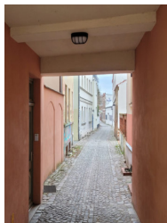
Die Gasse Kommu- nikation