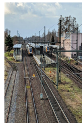
Am Hauptbahnhof unterwegs